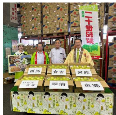
知事によるトップセールス