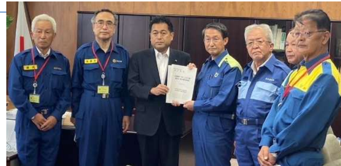
<野中農林水産副大臣への要請>