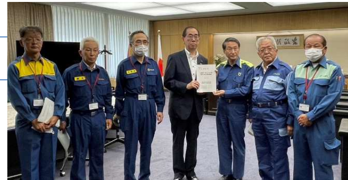
<松本総務大臣への要請>