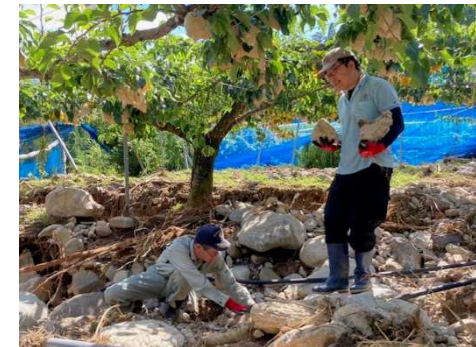
[JA・市・県職員による土砂撤去作業]

22日:農家は道路、園内道といった動線が確保出来次第、収穫・出荷の予定 (25日から出荷可能の見込み)