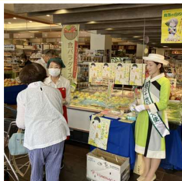
モリタ屋での試食宣伝